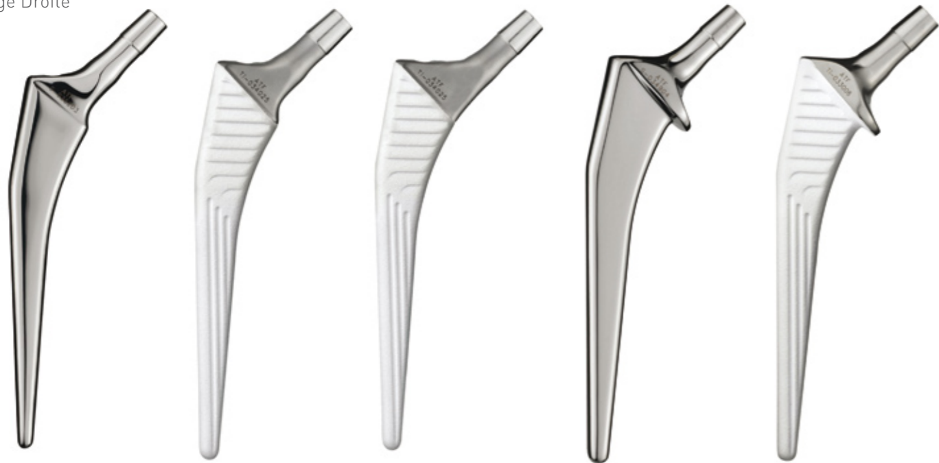
Cimentée Sans ciment Latéralisée Cimentée à collerette Sans ciment à collerette