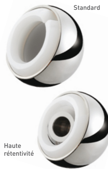
Standard Haute rétentivité