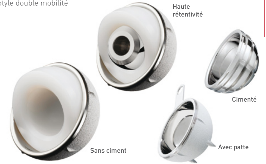
Haute rétentivité Cimenté Sans ciment Avec patte