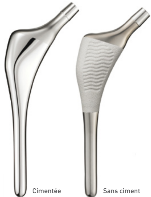
Cimentée Sans ciment