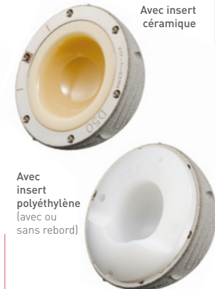
Avec insert polyéthylène (avec ou sans rebord)